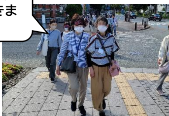
【ガイドボランティア養成講座】