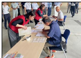
【ボランティアの受付】

訓練では、実際の流れをシミュレーションすることで、効率的な動線の確保や、必要な備品などを確認することができました。