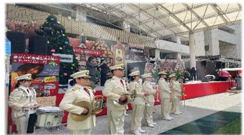
▲令和6年度福岡市障がい者週間記念の集い開会の様子

令和6年12月8日には「福岡市障がい者週間記念の集い」が市役所西側ふれあい広場・九州広場で開催されました。ボランティアセンターで募った学生ボランティアが、ステージコーナーの補助、会場誘導、着ぐるみ対応など、イベントの運営に協力しました。センター職員も、学生さんの懸命に活動されている姿を見て、改めて初心を思い出す良い機会となりました。毎年クリスマスマーケットと併設して行われます。来年度も開催予定ですので、ぜひ、みなさまも参加してみたいはいかがでしょうか。