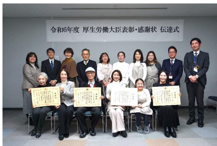
▲令和6年度厚生労働大臣表彰・感謝状 伝達式