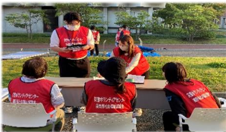
▲活動中の注意事項説明の様子

※学校法人西南学院は、福岡市及び福岡市社協と「福岡市災害ボランティアセンター設置に関する協定」を締結しており、福岡市内での災害発生時に早良区周辺の災害ボランティア活動の拠点として、西南学院大学の敷地内に災害VCを設置することを想定しています。