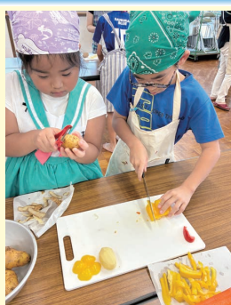
▲うまく切れるかな

西日本フードの担当者は、「私たちがお届けしているお肉が、地域食堂で役立てられたり、食べ物を大切に食べていただく意識を育むことにつながったら、とても嬉しいです」と話されました。