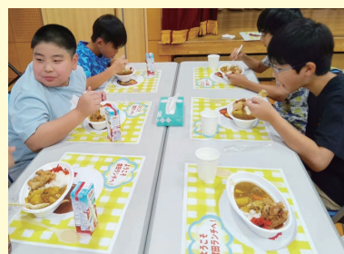
▲ライスカレーを食べながら、楽しくおしゃべり

食事の後は、公民館実施のボランティアによる夏休み宿題サポートも行なわれ、楽しい夏休みの1日となりました。