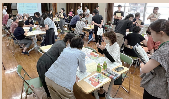
▲校区内のボランティアが集まりました

令和7年8月23日、三筑校区において、災害時に備える体制づくりについての座談会が開催され、自治会・町内会長や民生委員・児童委員、校区社協のボランティアなどが参加しました。