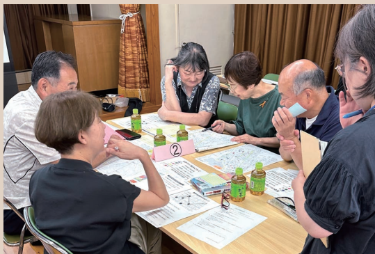
▲災害時をイメージして話し合っています

福岡市社協では、地域での日頃からの見守り体制づくりを進めており、その活動や体制を活かし、災害時にも支え合える地域づくりに取り組んでいます。