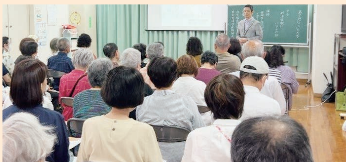
▲終活サポートセンターの出前講座の様子

今後も東区社協では、校区社協とともに、地域の福祉課題に寄り添った活動を推進していきます。