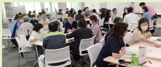
▲スタートアップ交流会での様子