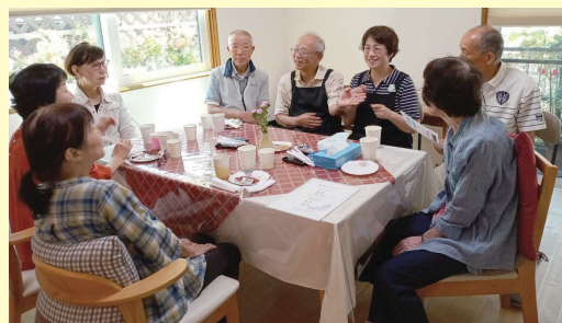
▲お茶を飲みつつ、色んな話ができます