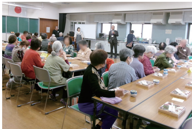
▲原エリアの方が集まった原西公民館

また当日は、事業所ネットワーク(※1)の「介活ネットさわら中央(※2)」に来ていただき、3か所の会場でフラダンスやピアノ演奏などの出し物を披露いただきました。