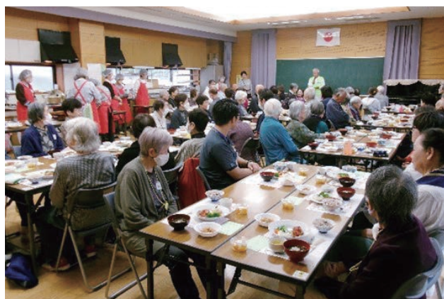
▲事業所の方も一緒に食事を楽しみました

野芥校区は坂道が多く、校区内での高低差が非常に大きいため、「会食会に参加したいが、公民館までは遠くて参加できない」という声が地域から寄せられていました。そこで校区社協から、事業所ネットワークの「さわらまんなかネット(※3)」に相談し、各事業所で保有している車両を使い、送迎の協力を得ることができました。さらに当日は、受付や会場内での付き添いなどにも協力いただきました。