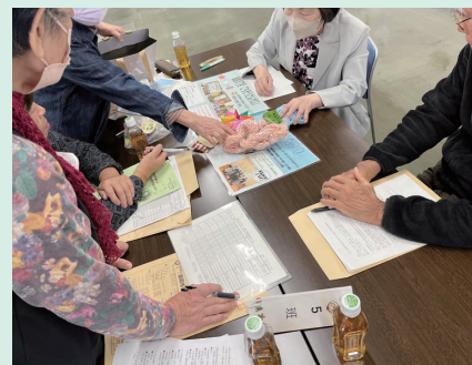
▲サロンで作成した手芸作品を披露!

ニュースポーツの熱気をそのままに行なわれた情報交換では、サロンで作成した雑貨や人気のプログラムを紹介し合いました。「それいいね。講師はどこにお願いしたらいいの」など活発な声が聞かれました。他校区のサロンの状況を知ることができ、今後のサロン活動のヒントになったようです。