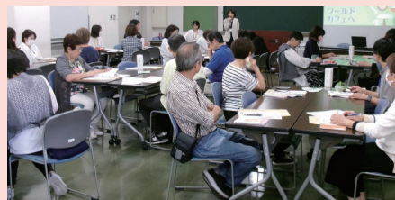
▲13団体にご参加いただきました

早良区社協事務所は、今後も「子どもの居場所づくり」に取り組む皆さまを応援していきます。