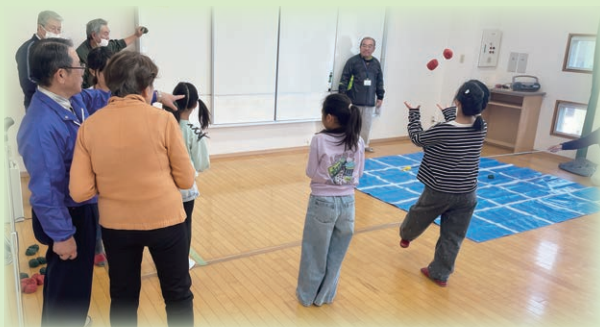
▲大人も子どももいっしょにゲーム!

3月に行なわれたカフェでは、筑前高校の生徒がボランティアとして参加し、ギターの弾き語りと一緒に歌い、お茶菓子の配膳をする等、参加者の皆さまからとても喜ばれていました。