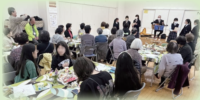
▲元警察官のギターの弾き語りに合わせて歌う高校生

周船寺校区では、誰もが住み慣れた地域でいつまでも元気に暮らし続けることができるよう、「地域包括ケア」の推進に取り組んでいます。令和5年度は、誰もが集える居場所づくりとして、「地域カフェ」を試行的に3回開催し、高齢者を始め、子育て世代、小学生等、ボランティアを含め延べ300名以上の方が参加しました。