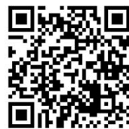
(福岡ファミリーサポートセンターの概要)