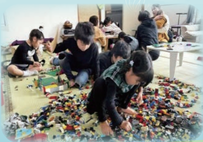
▲レゴに夢中! 何つくってるの?

地域の方に寄贈していただいたレゴで、遊び場のスペースも開設し、毎回親子が7~8組、約30名が利用しています。