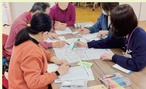
▲校区情報をマップに記入する様子

また、今後の地域福祉活動に活用していくために、懇談会で共有された「集いの場」等の情報を地図上に掲載した「福祉マップ」も作成しました。