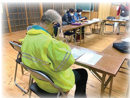
▲電話で安否確認する担当者

周船寺校区では、校区社協と校区防犯推進委員会との共催で、毎年要支援者避難訓練と認知症行方不明者捜索・声かけ訓練を実施しています。令和2年度からは新型コロナウイルス感染拡大防止のため、11～12月の間で日程をずらして町内ごとの実施となり、より身近な訓練が行われています。