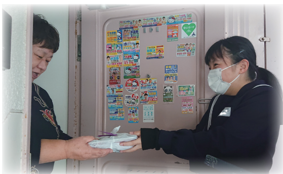
▲いつまでもお元気でください!