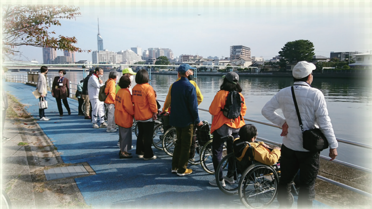
▲今日はいい天気になったね～

愛宕校区では、令和3年11月16日に車いすを使用されている方と地域住民がふれあう「車いす散歩」を、11月25日に住民の皆さんと一緒にウォーキングする「ふれあい散歩」を実施しました。