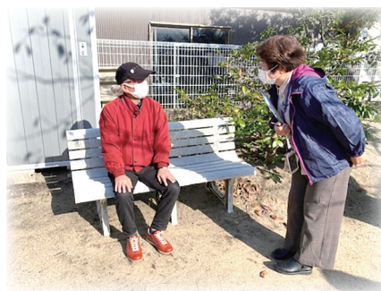
▲発見時の声のかけ方が大切