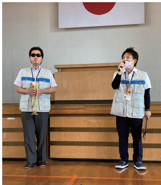
トランペット演奏による、 町内対抗“懐メロ”イントロクイズ