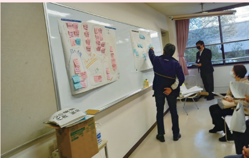
“わたしたちにできること”話し合いの発表

シニア世代(概ね50歳以上)を対象に、こころの病について一緒に学び、理解を深めながら、ボランティア活動を養成することを目的に、講座を実施しました(受講者26名)。