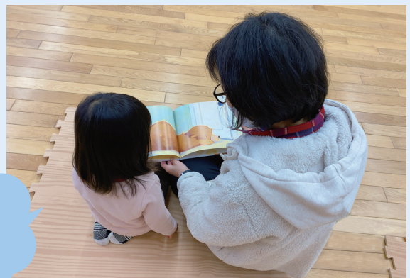
親子で楽しく読んでいます