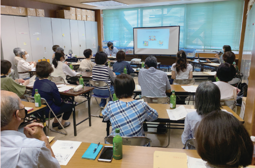
精神科医による講話