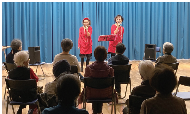
「ヒロ&エリ」の軽快なトークと歌で盛り上がりました

会がお開きになると、参加者の皆さんはお弁当と元気をお土産に、満面の笑顔で帰っていかれました。