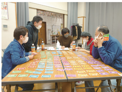
何を手伝ってもらおうかな～？

大楠校区では、生活支援ボランティアグループ“そよかぜ”が、「ちょっとした困りごとを助け合える地域にしたい!」という思いから、校区住民を対象にボランティア養成研修会を開催しました。