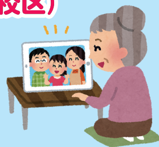
▲パソコンでオンライン交流

事前に高齢者のこころや体の特性、病気などの学習を行った上で、中学生が自分たちで交流プログラムを考えた結果、ジェスチャーゲームや座ってできる体操教室などが行われ、高齢者と共に楽しみました。