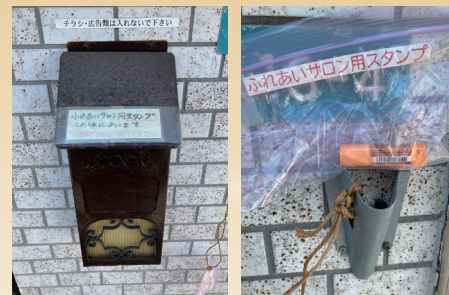
▲スタンプが入った郵便受け