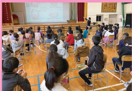
小学生にも分かりやすい、「認知症キッズサポーター講座」を実施しました。