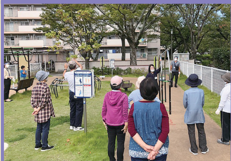
原団地内にある「健康広場」や集会所で実施した健康講座(UR都市機構主催)に協力しました。