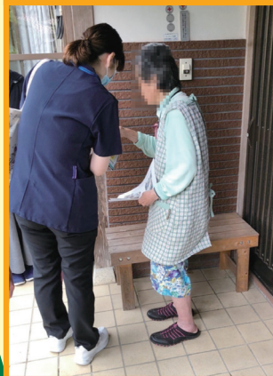
感染症対策に十分留意しながら、自粛期間中の見守り訪問活動を実施しました。