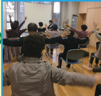
「いいはら福祉サロン」にて介護予防体操を行いました。