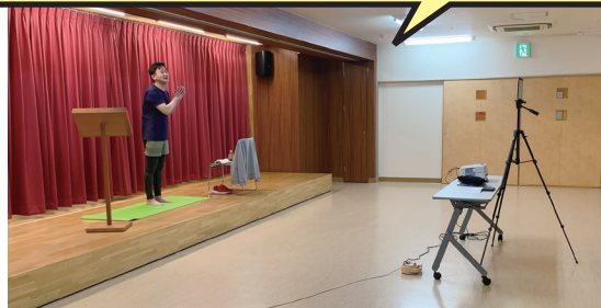
白熊園デイサービスセンター