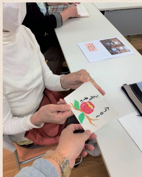
「わあ、かわいい!!」喜んで受け取られました