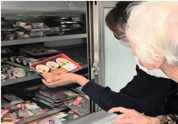
▲冷蔵車による生鮮食品販売

令和2年2月13日(木)12時、下月隈中央公園で青空市場(移動販売)「なかよしマーケット青い鳥」がスタートしました。これは、博多区でも最も高齢化が進む下月隈団地(高齢化率42%)に住む高齢者や障がい者など、買い物が困難な住民を支援するため、下月隈団地自治会が中心となり、市及び市・区社会福祉協議会、協力事業者が連携し開始したものです。