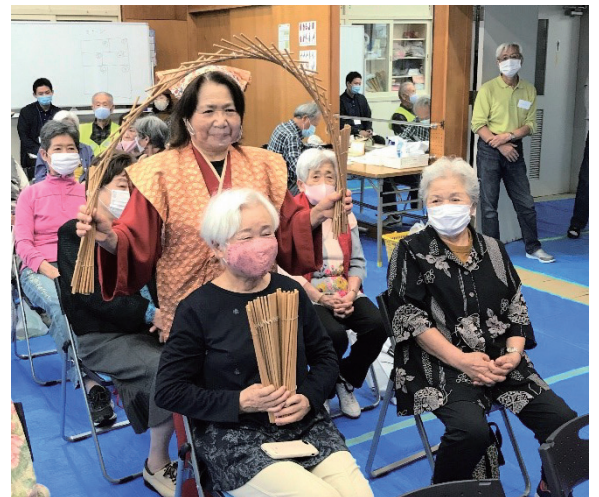
▲ふれあいサロンで「南京玉すだれ」