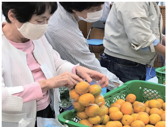
▲ミカンの袋詰め 100円

また、販売会場では業者によるバナナのたたき売り、ミカンの袋詰め、抽選会などイベントも開催され、集客も伸びています。