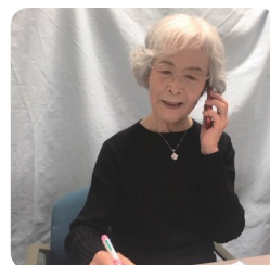
笑みの会のメンバー

例「今朝の新聞にね、新聞配達のお兄ちゃんから「寒くなったのであったかくしてくださいね」ってメモが貼ってあったの。ちょっとしたことだけど、そのきれいな心に感動した～」などのうれしかったことや悲しかったこと、なんでもお話しください。