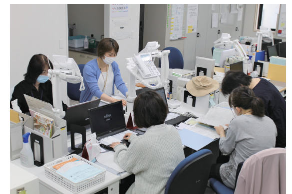
▲事務所の中の様子です

福岡市社会福祉協議会として初めての介護保険事業への参入となるため、これまで築き上げてきた地域との信頼関係や多様なネットワークを活かし、地域、行政、介護・医療関係機関等とより緊密な連携を図り、相談者が在宅でよりよい暮らしを送れるように支援してまいります。