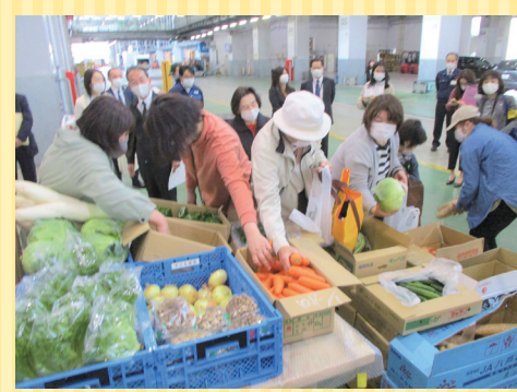
子ども食堂への食材提供の様子

令和元年度よりJA福岡市と同様の協働事業を実施していますが、東区がエリア外となっていたため、今回の協働事業により、全市での食材提供支援が実現しました。