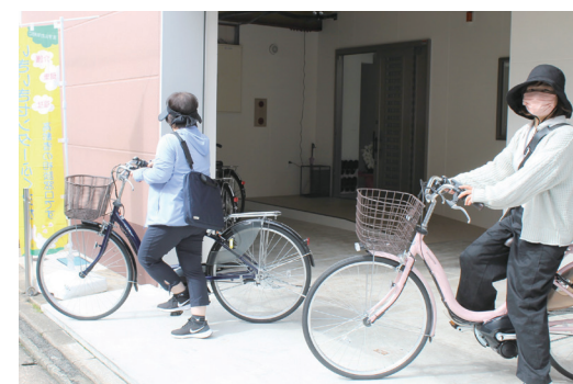
▲相談者のお宅を訪問します

【お問合せ】 城南第2いきいきセンターふくおか (担当圏域：金山校区、七隈校区) ☎866-8511