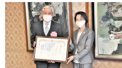
東花畑校区ふれあいネット“5愛”推進会