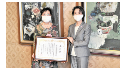
板付校区社会福祉協議会

ひとり暮らし高齢者等が地域で孤立せず安心して生活できるよう、見守り活動において他の模範となるような先駆的な活動に取り組んでいる団体として、市内の2団体が受賞されました。