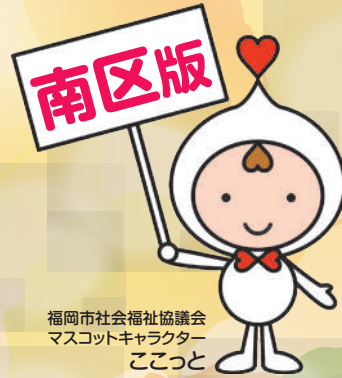
福岡市社会福祉協議会 マスコットキャラクター ここと